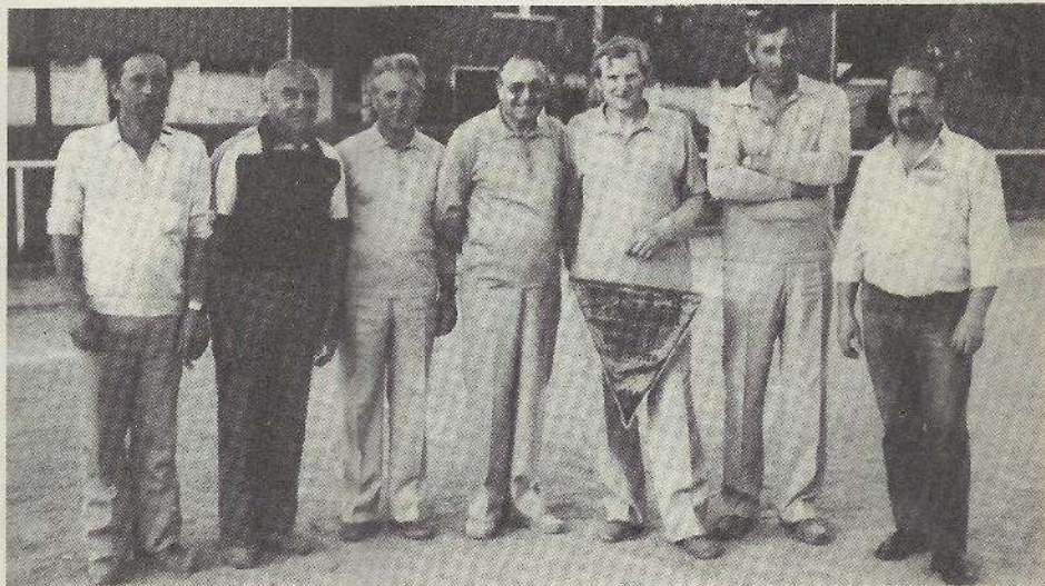
L'équipe de 3 e division de l'U.S. Ris Orangis avec les représentants du Comité

très près l'une de l'autre, et ce fut un duel entre les 2 clubs de Ris Orangis, le Club Bouliste du Plateau et l'Union Sportive qui dans la même formation remporta le titre en 1981. Après une partie très