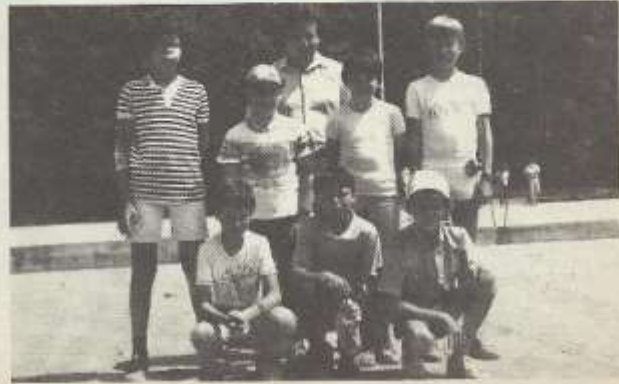
Champions et finalistes Minimes.