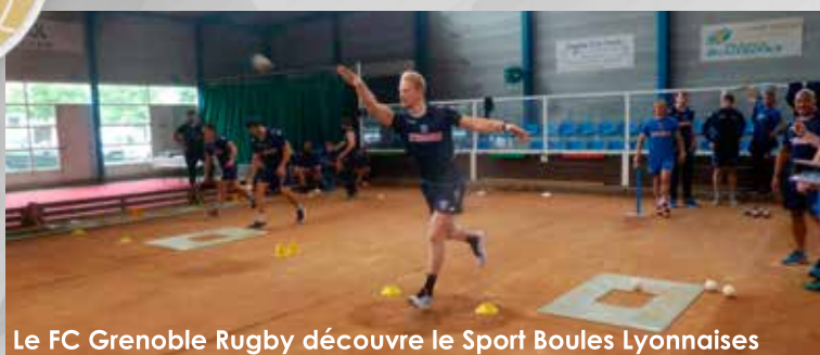
Le FC Grenoble Rugby découvre le Sport Boules Lyonnaises