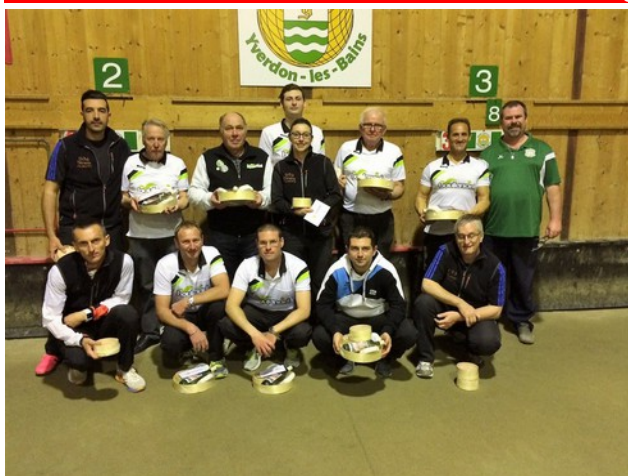
Carouge (en blanc) championne suisse interclubs face à Genève Sport-boules (en bleu et noir)