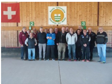
Les participants à la formation