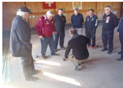
Phase pratique de la formation d'arbitre