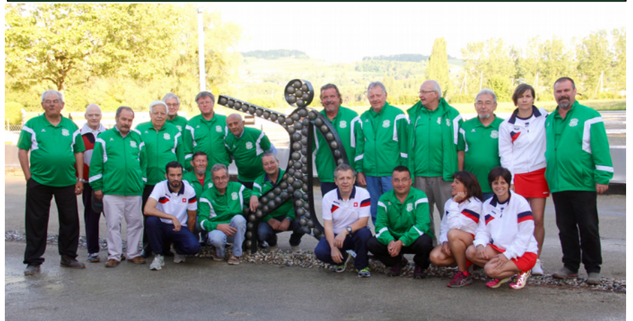
Les membres d'Yverdon, entourant la sculpture réalisée par F. Bachmann (à g.)

Les festivités se sont poursuivies autour d'un buffet-apéritif très convivial. Désormais, pour marquer cet anniversaire, une magnifique sculpture, réalisée par Fernand Bachmann, veille sur le boulodrome.